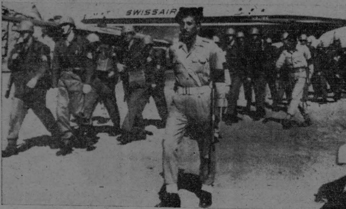
La foto muestra la llegada de las primeras tropas de las Naciones Unidas a Ismailia, Egipto, integradas por 95 oficiales y soldados, procedentes de Dinamarca y Noruega, que escoltadas por soldados egipcios, se dirigen a los lugares designados por el gobierno egipcio, para mantener la paz mientras se resuelve el problema de la zona del Canal de Suez