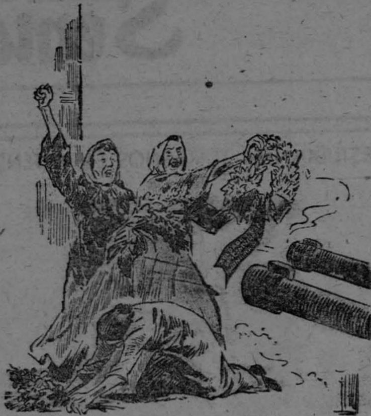
AHORA ASESINAN A MUJERES ARMADAS CON FLORES

De "ULTIMAS NOTICIAS", de la ciudad de México